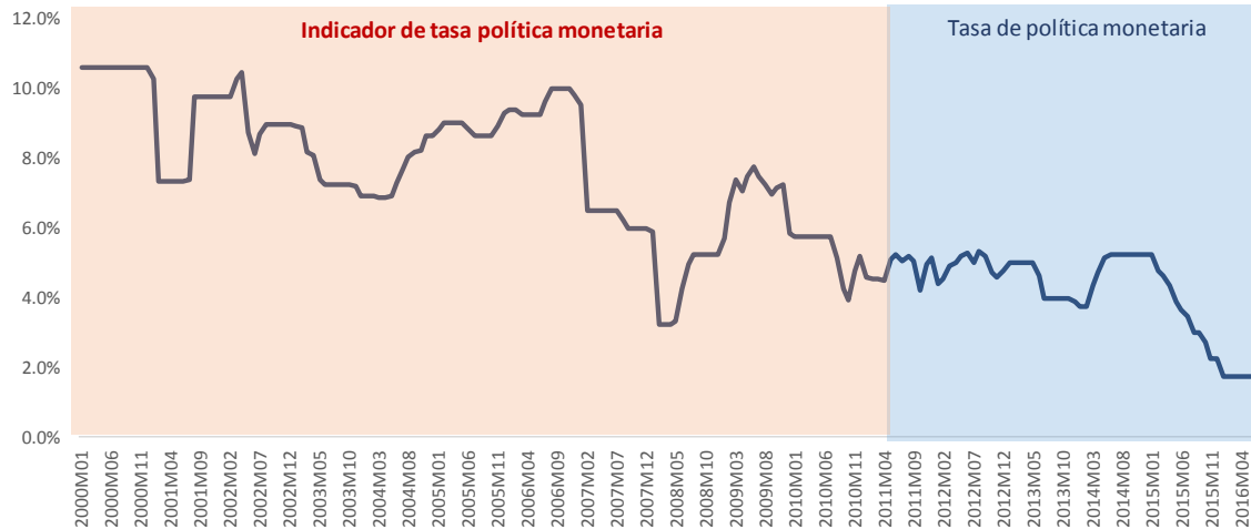
Gráfico1 Costa Rica: Tasa de política monetaria